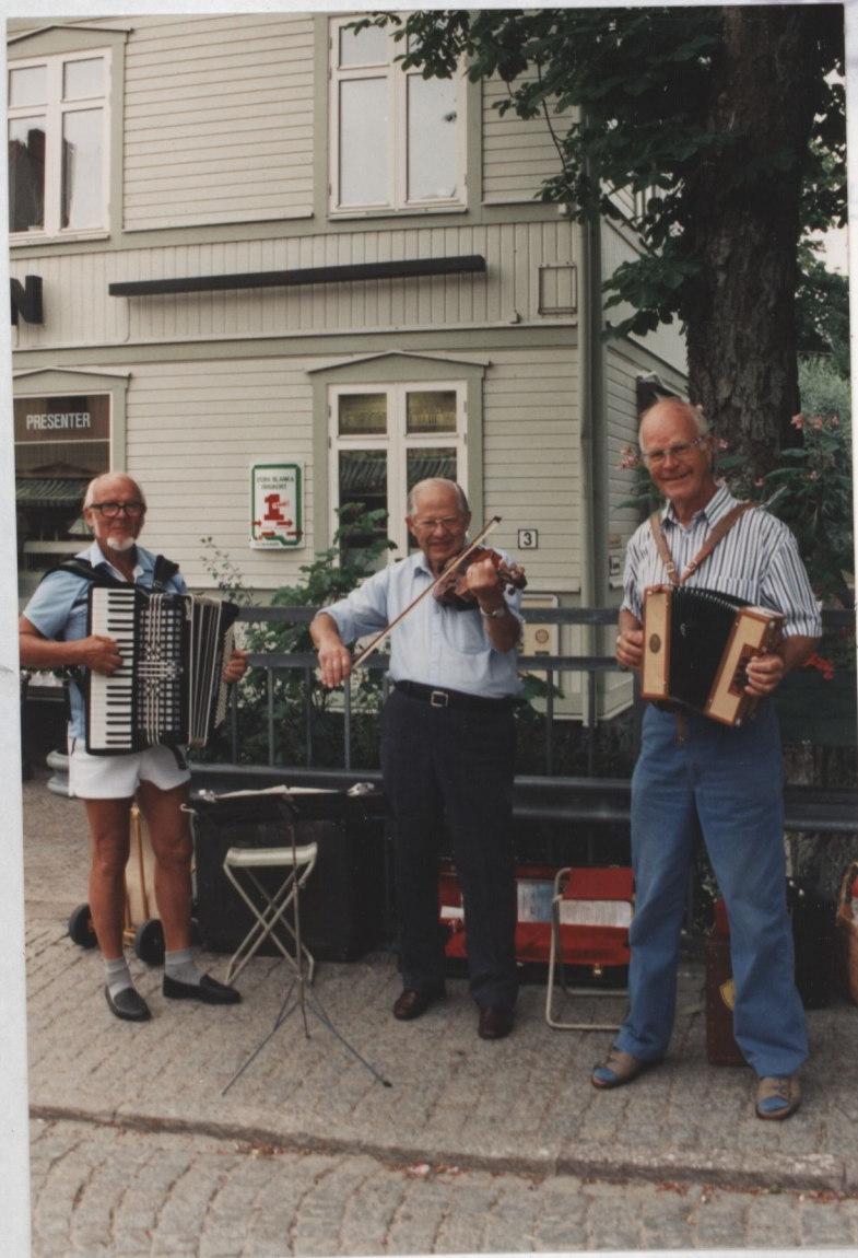
"3 GUBBAR" SPELAR PÅ TORGET I TRÖSA. 30 JULI 1994.