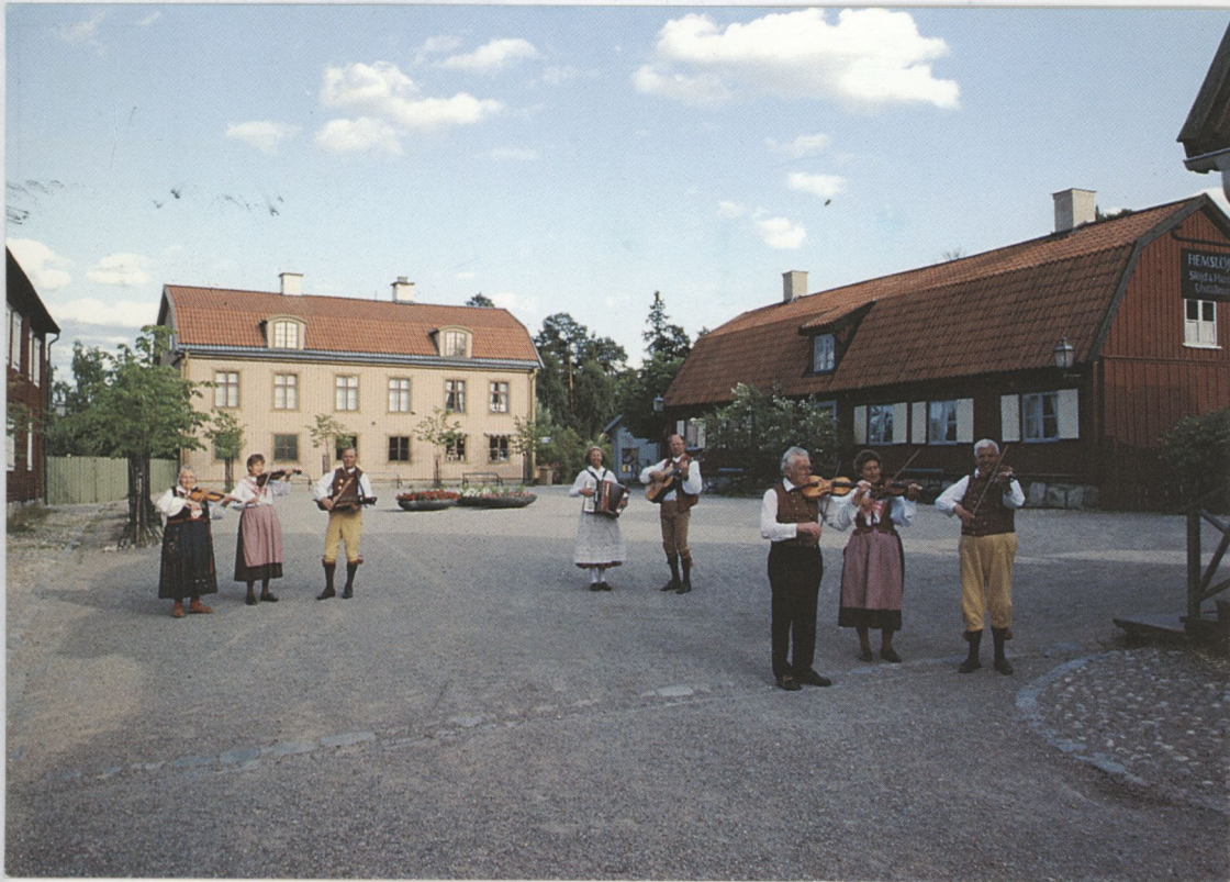
Vid museitorget i stads kvarteret på Örekällberget.