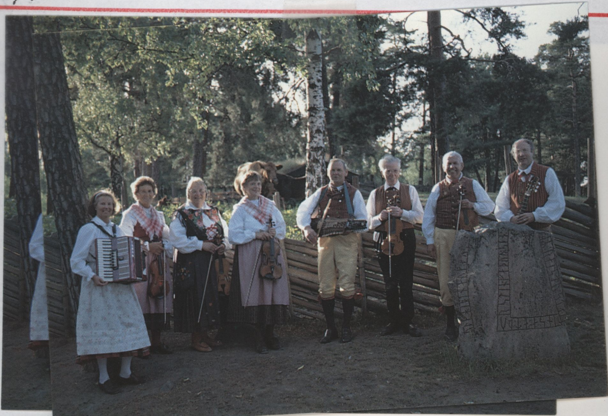
På Örekällberget, vid runstenen för Bästertälje