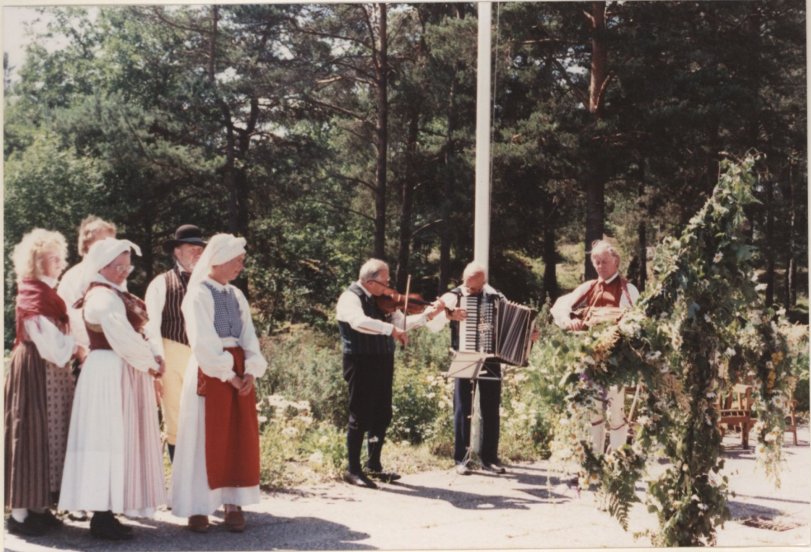
↑ PÅ TROSA- GÅRDEN