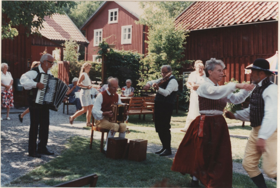
↑ PÅ GARVAREGÅRDEN 1989