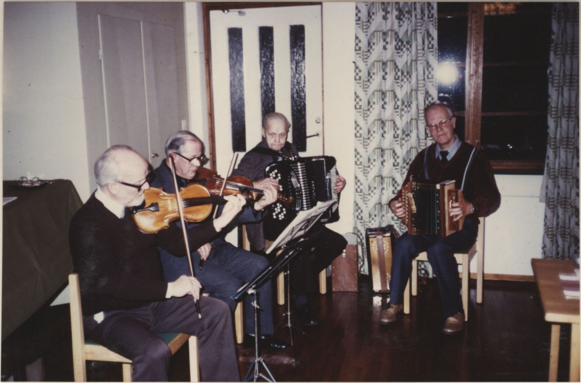
4 GUBBAR FRÅN TROSA. spelar på Hembygdsföreningens årsmöte i Församlingshemmet 15 mars 1989.