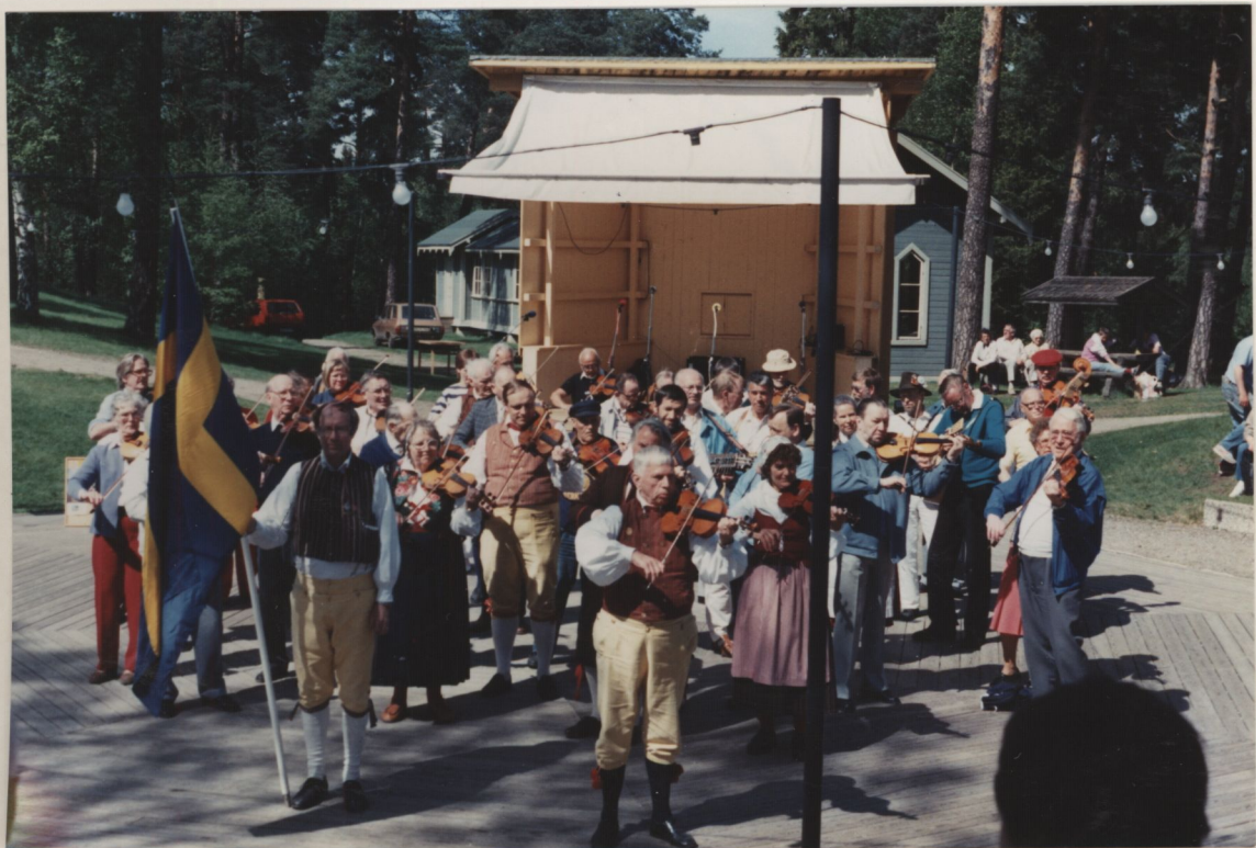
Annandag Pingst, 15 maj 1989 på Torekällberget i Södertälje.