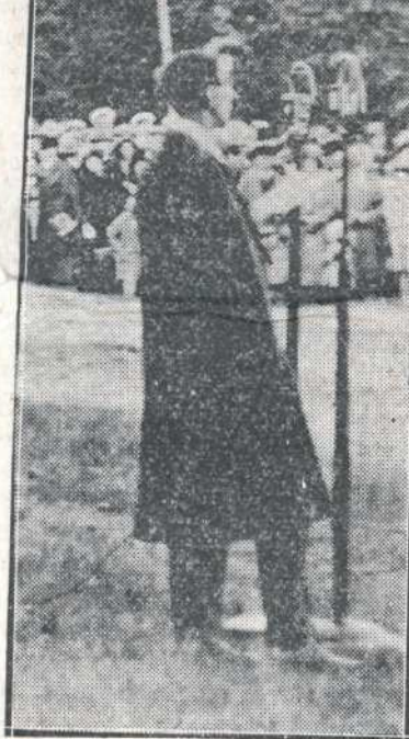
H. K. H. prins Wilhelm.