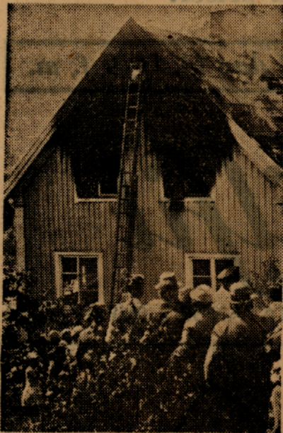
En bild från brandplatsen.

En häftig eldsvåda utbröt strax efter kl. 12 på söndagen i en tvåfamiljsvilla vid Järnväggsgatan 96 i Sundbyberg. Då det visade sig svårt att släcka elden tillkallades hjälp från Stockholm, varifrån brandkåren ryckte ut med en motorspruta. Vid ett-tiden såg det ut, som om villan ej skulle kunna räddas. Brandmännen arbetade emellertid energiskt med flera slangledning och lyckades begränsa el-