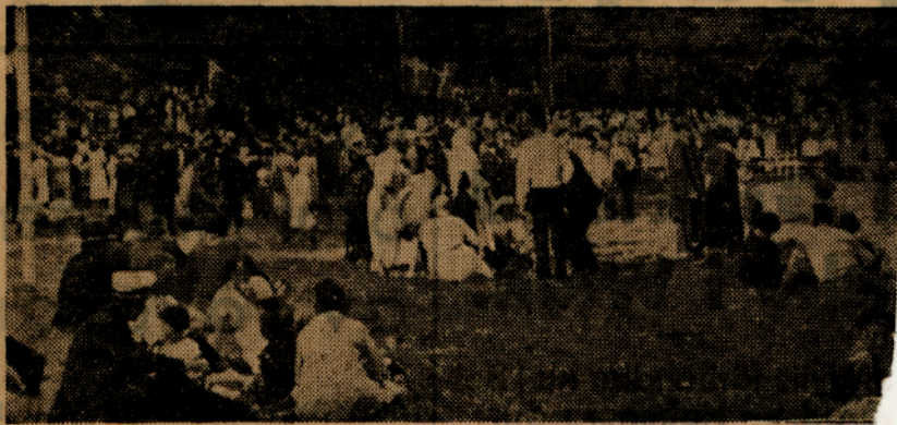
Stenhammar är en högst förnämlig festplats.

Storslagen hembygdsfest och spelmansstämma på Stenhammar. — 5,000 deltagare.