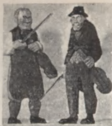
Spelmän - Gunnarssons ateljéer, Stockholm