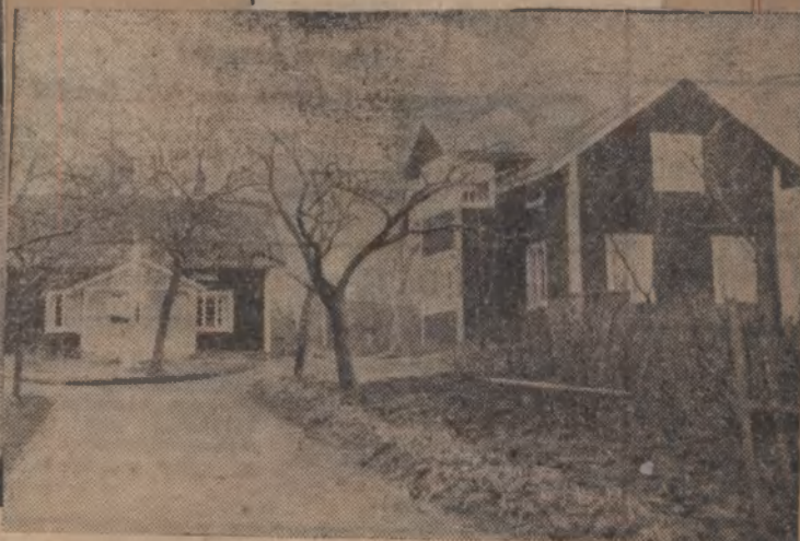
Gården Norskogen i Skedevi.