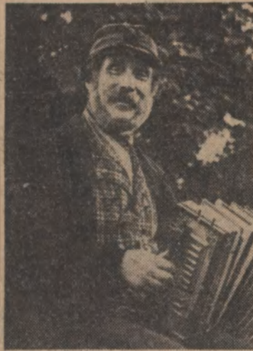
"Nergårds-Lasse" under Skansenåren.

Fina akvareller har han på vägarna och många utsökta minnen från den tiden han själv låg vid Konstakademien och fick första pris