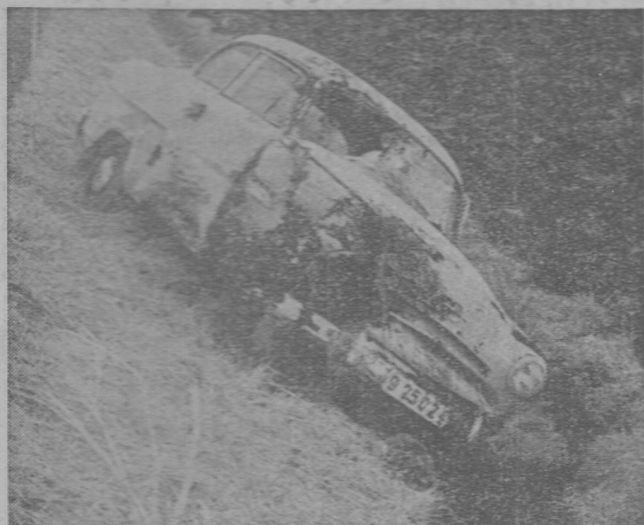
Olycksbilen rutschade över kanten till det djupa diket, borrade sig ner i leran på åkern, slog runt och blev liggande med kylaren mot färdriktningen.