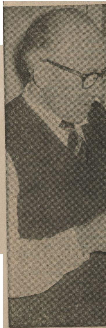
Att det finns nattvioler, det natt;k**r, det kanske var en att inte

Fiolbyggare växer inte på tr Det vet alla våra violinister, s värdesätter goda fiolbyggare deles särskilt högt. Fiolbyggarn är kanske till en början en ho men blir i många fall fiolbygg rens huvudsaklig verksamhet e en tid. Sjösa-Kalle eller Gott