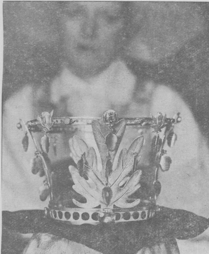
Klenoden i fröken Ericsons smyckesamling är den här vackra brudkronan i förgylld mässing med "ädelstenar" av blått flussglas, gjord i Blekinge i slutet på 1700-talet.