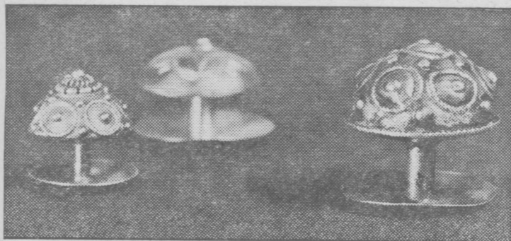
Så här stort dimensionerade och så här vackert arbetade var kragknapparna i gamla tider.