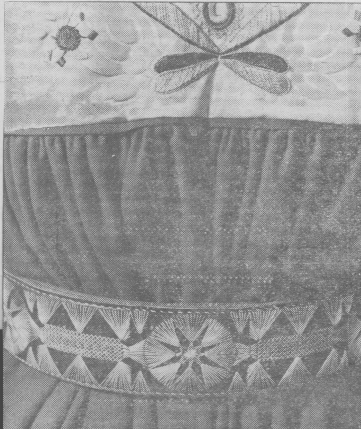
Broderat läderbälte och broderat liv på gul damast hör till grannlåttsdräkten. Färger och mönster är utsökta (nedan).