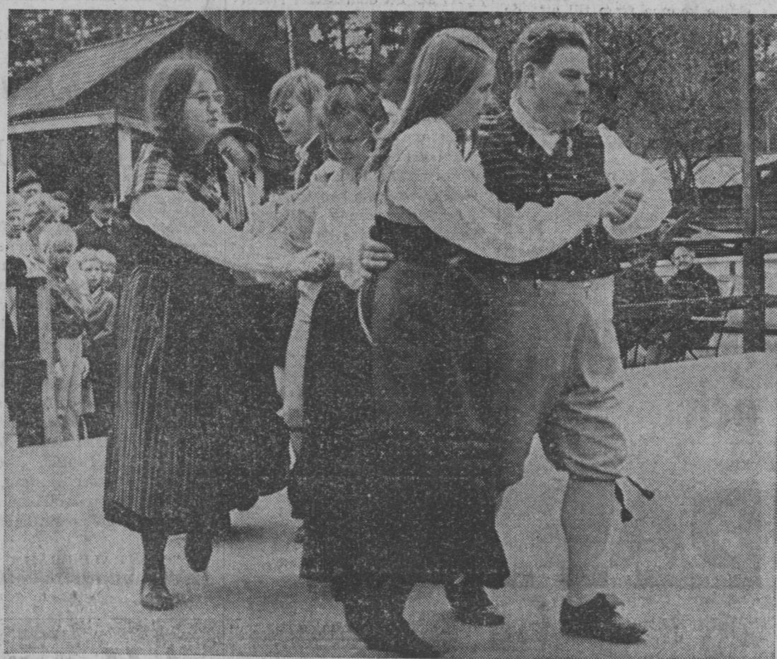
Vid dansbanan vid Råbygårdstunet på Torekällberget hade SGU:s folkdanslag från Stockholm uppvisningar. Här är det dansar nas ungdomar som svänger runt i en av de ovanligare danserna.

Rekarne spelmanslag från Eskilstuna var först på scenen och sedan stod det inte länge på förrän scenens kvadratmetrar var fyllda till bristningsgränsen av såväl unga som gamla musikanter.