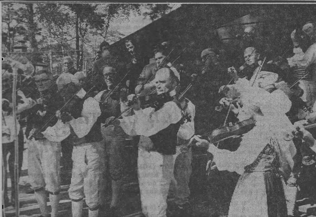
1.000 personer samlades på Torekällberget i Södertälje för att bli lyssna på de sörmländska spelmännen.