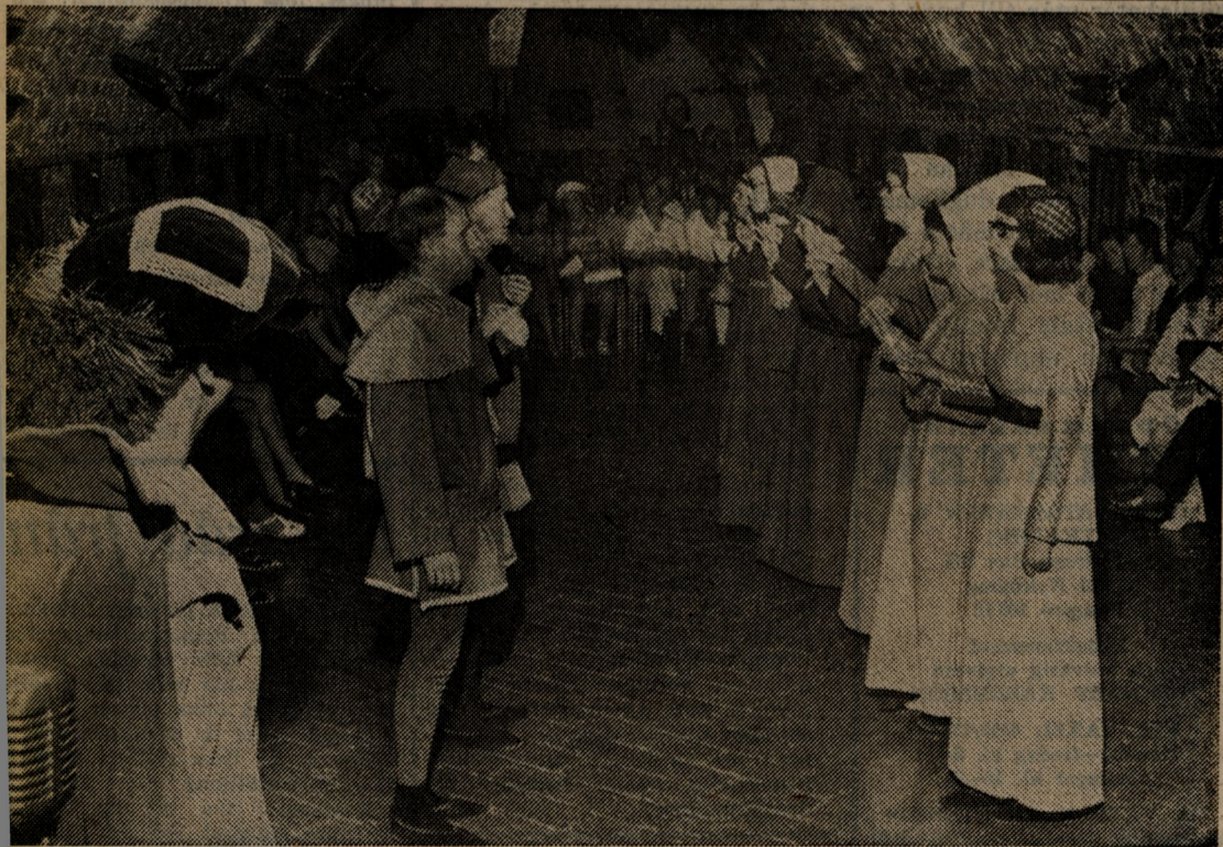
Ett folkdanslag ställer upp till en medeltida dans i tidsenlig kläddräkt och miljö på Nyköpingshus.

Hela eftermiddagen pågick dansen och musiken såväl inne i salarna som ute på borggården. Några japanska gäster måste ha betraktat tillställningen som mycket exotisk. — Sidan 5 —