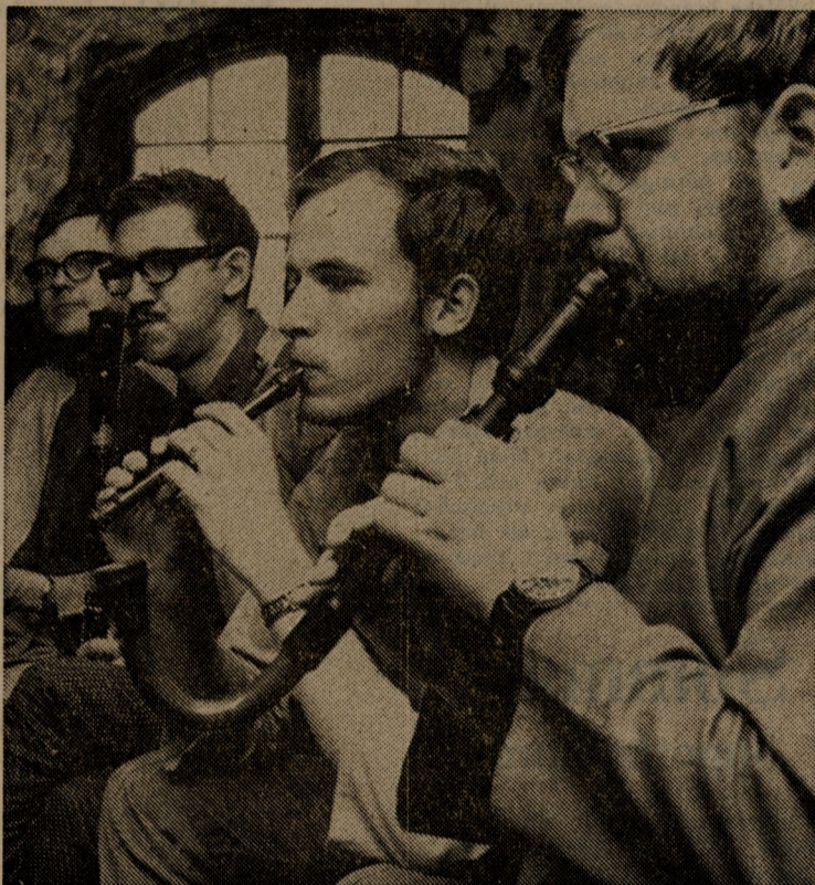
En hel del ovanliga instrument trakterades vid Festisalen. Här försöker några spelmän locka toner ur något som liknar flöjter.

Branle, farandole, polska, vals, kontradanser, schottis, polketter osv är alla danser som svensk allmog har dansat vid bröllop och andra fester och som åskådarna nu fick se i tidstypisk miljö. Några exklusiva men anspråkslösa instrument frambringade säregna ljud. Spilopipan —