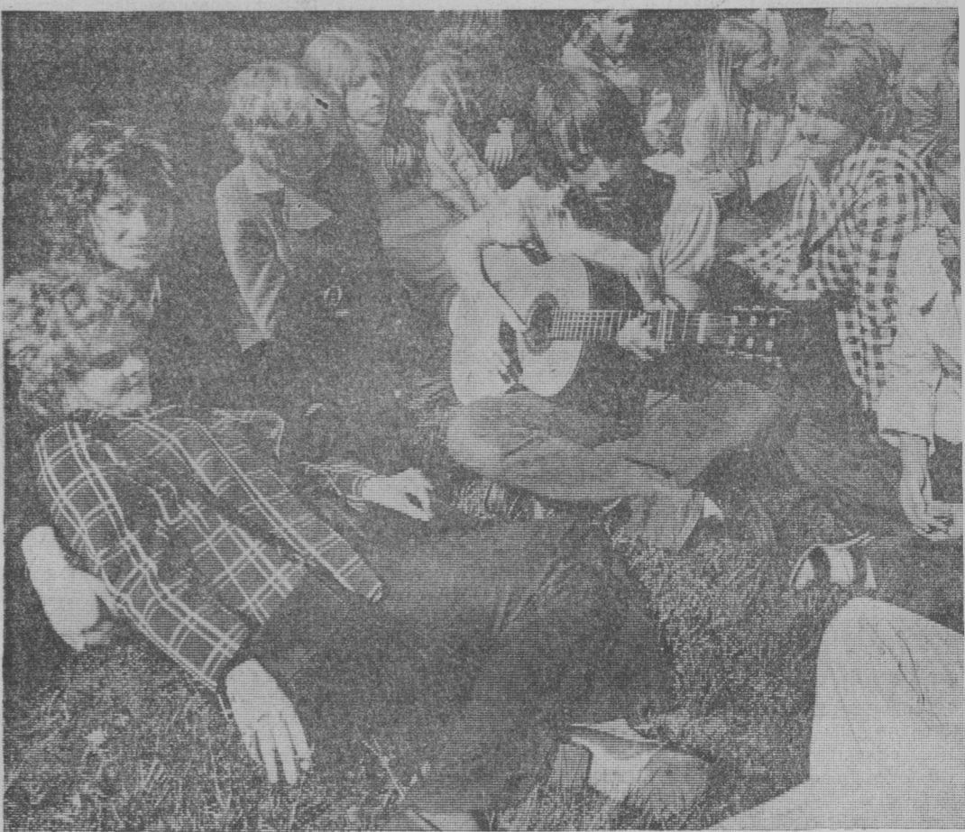
Den som har gitarr måste spela. Här har Sollentunas folkdansare och ungdomar slagit sig ner i Men det blev en liten modernare Cornelisvariant som storstadsungdomarna stämde upp.