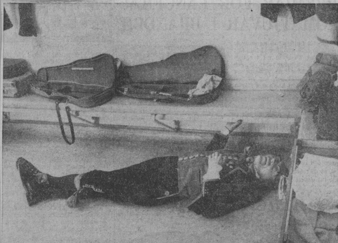
En trött spelman har somnat på ett golv. Fiolfodralen har hedersplats på bänken. Ett storting med spelglädje fördrar också vila för att felan skall låta rätt.