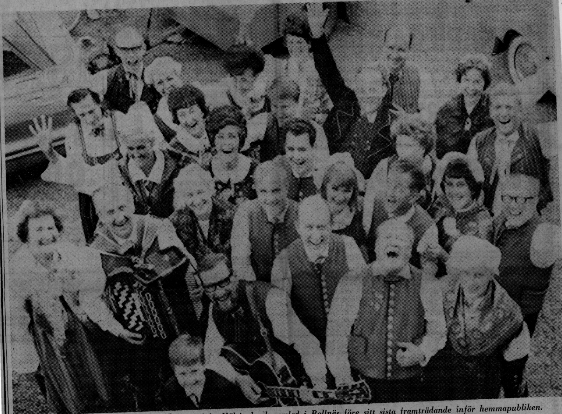
Sveriges största musikersläkt, Östarna från Hälsingland, samlad i Bollnäs före sitt sista framträdande inför hemmapubliken.