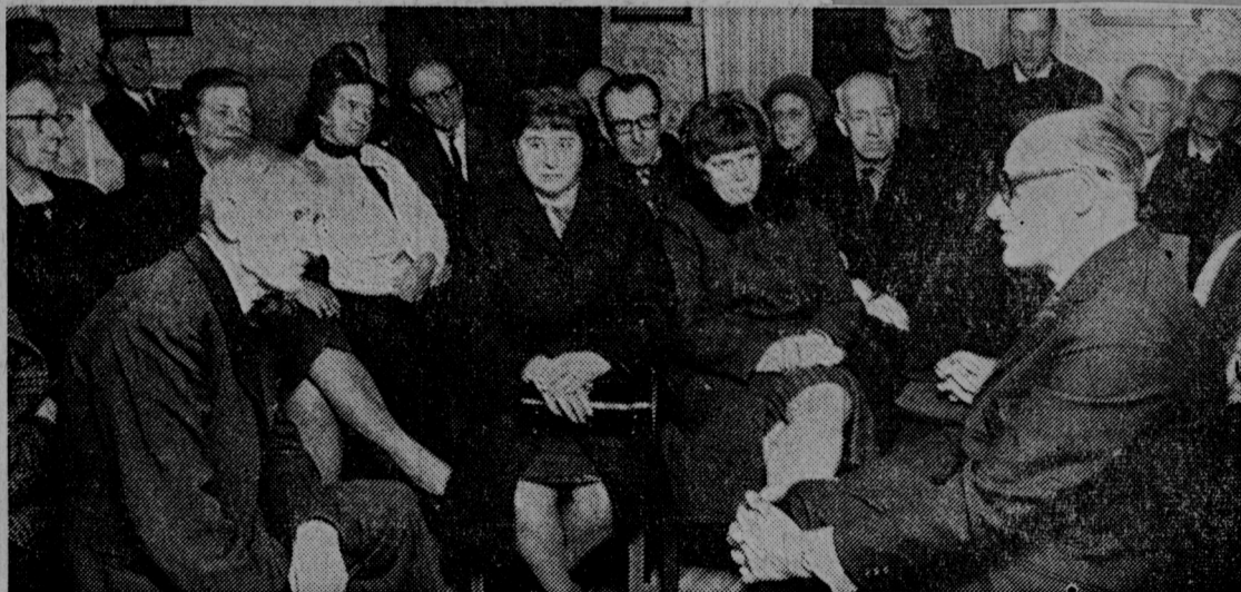
Trångt och trivsamt hade ordföranden i Björnlunda hembygdsförening omkring sig, när föreningen inbjöd till vinterhalvårets första brasafton.

Dessutom förekom kaffesamkväm, pratades det och trivdes medan marchallerna utomhus saktat brann ned i den mörka höstkvällen.