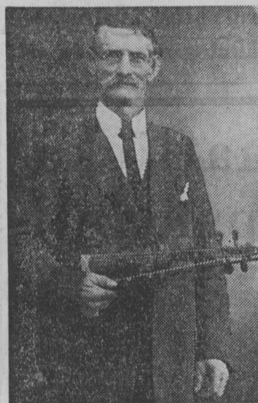
□ Genom allt som den gamle riksspelmannen skapat med sina händer och genom alla sina låtar, som ännu i dag spelas av alla sörmländska spelmän, har han skapat sig ett monument, varaktigare än kopparn.