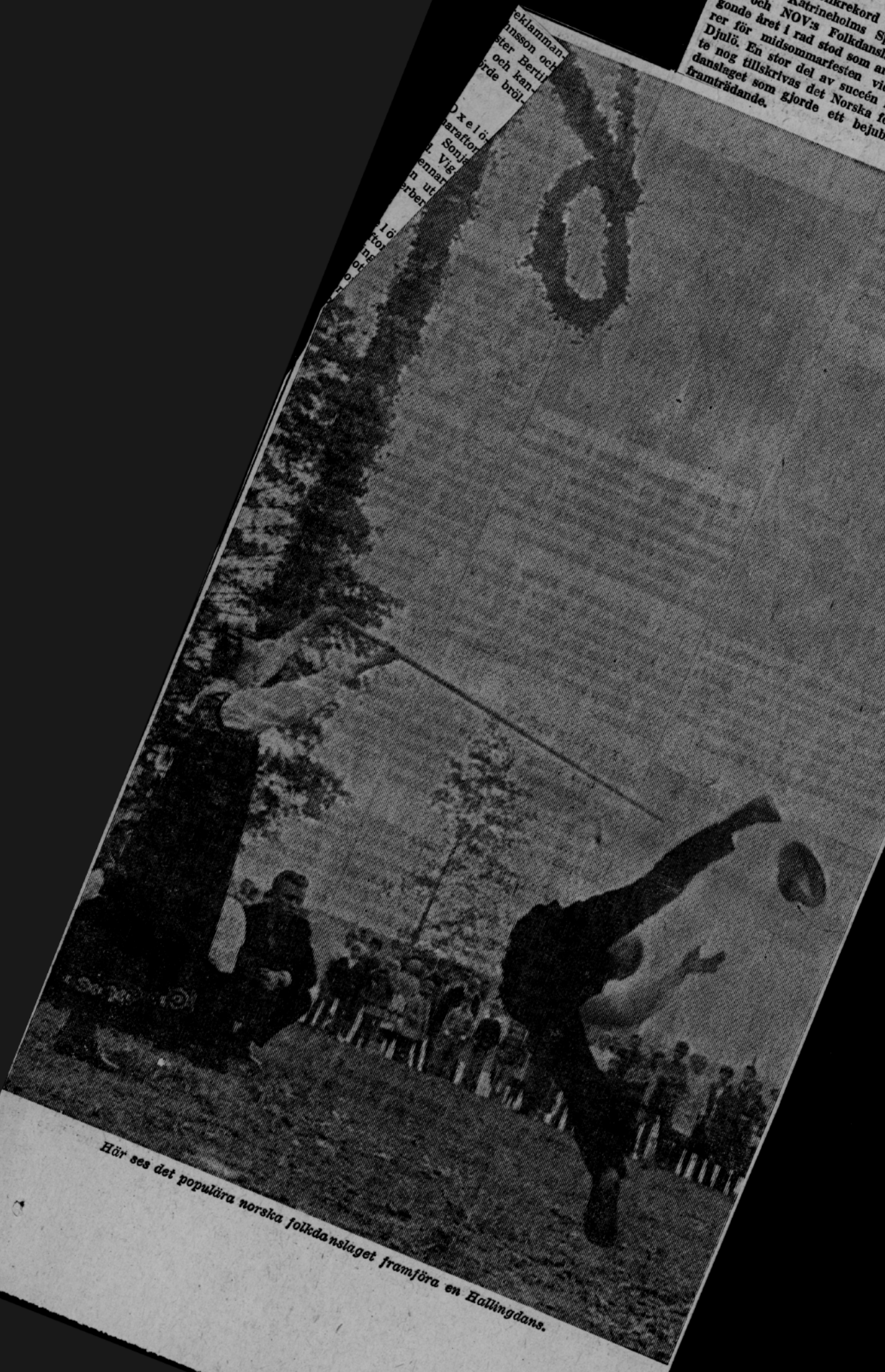
Här ses det populära norska folkdanslaget framföra en Hallingdans.