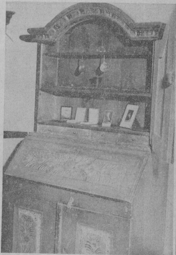
Ett äkta gammalt Vingåkersskåp i vilket museets dyrbarheter förvaras. Att skåpet är tillverkat i Vingåker av ett speciellt "bomärke" i centrum av klaffens målningar.

I rummet med Vingåkersdräkterna har ett särskilt militärhörn inretts. Här finns bl.a. Vingåkers skarpskytteförenings gamla