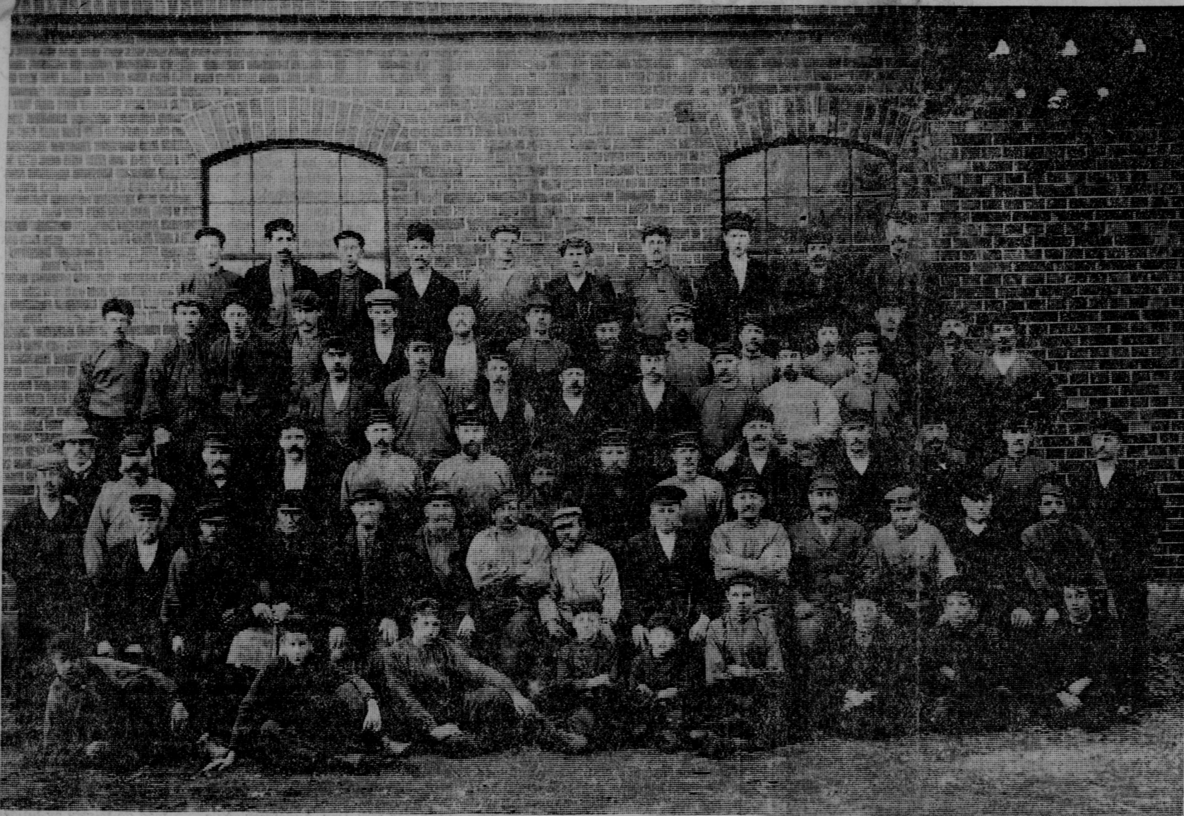
För cirka 65 år sedan togs den här bilden i Värmbol av nästan alla då anställda. Samtliga 69 namnges i texten här under. Av allt att döma är 66 av dem bortgångna. Den äldste av dem föddes för 139 år sedan.