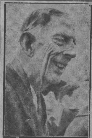
HERTIGEN AV SÖDERMANLAND prins Wilhelm, glädde sig åt besöket av brodern kungen.