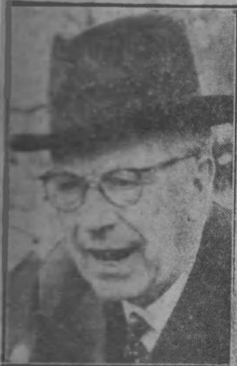
KUNGEN TOG GOD TID på sig då han hälsade sig med sömn- länningarna som mött upp vid Uppsala kungshög. I Nyköping och Oxelösund för att kylla honom i går.

bilarna för avfärd till Oxelösund. Presidierna i de kommunala orga- nisationerna hade mött upp och hälsade majestätet välkommen. in- nan verkställande direktören I. Kull presenterade järnverket.