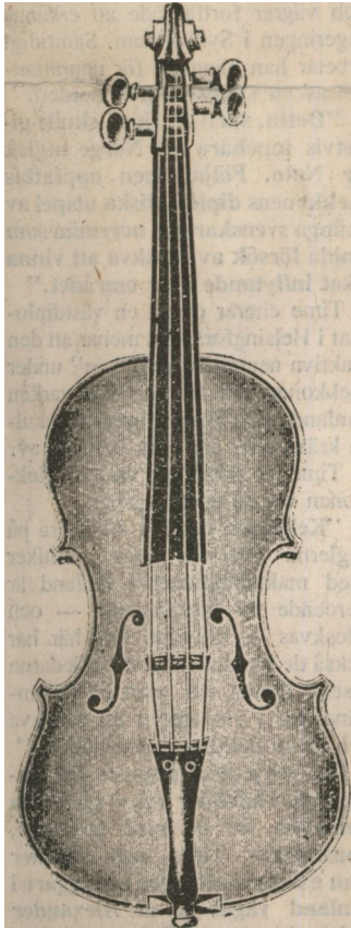
Violin Stradivarius, fulländad imitation av de äkta stradiva- rierna. Gulröd lackering.

Vid en danstillställning på Bo- marsund inträdde en främmande herre och började dansa med en prästfru, som var känd för att dansa väl och gärna. Han sluta- de ej, och ej ens spelmannen kunde upphöra att spela, ty även då man skar av fiolsträngarna, fortsatte musiken. Då visste man att dansaren var hin häle. Kyr- koherden i Hammarland, som hade en skild förmåga att driva ut djävulen, efterskickades och anlände följande morgon, då