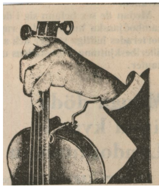
Handledshållare för nybörjare. Nysilver och filt. Underlättar inlärandet av en riktig handställ- ning.

dansen ännu pågick. Han stack med en nål ett hål i fönsterblyet och fick genom en kraftig bön djävulen att försvinna genom hå- let. Pastorskan hämtade sig och dansade aldrig mera.