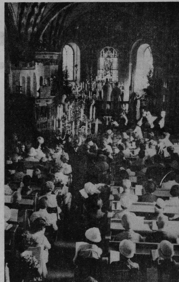
Kyrkan var till trängsel fylld vid söndagens högmässa i folkton.

Gatudans, utspisning med ärtsoppa, tillagad i fältkök på Malmaheden, samt underhållning vid Hembygdsgården fanns även med på programmet.