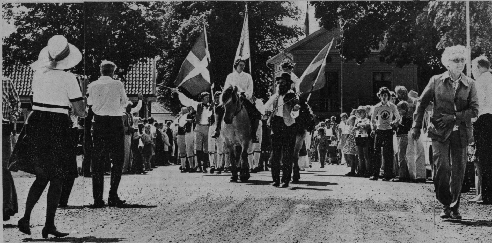
Festtåget med förridare på fjordingar drar fram genom Malmköping.

Runt om i länet har det vimlat av spelmän och folkdanslag denna strålände helg men priset tog nog ändå Malmahed där länets spelmansförbund 50-årsjubilerade på söndagen på själva födelseplatsen. Där var allmusik och alldans, festtåg genom samhället, ärtsoppa ur kokvagn på heden, tal och uppvisningar