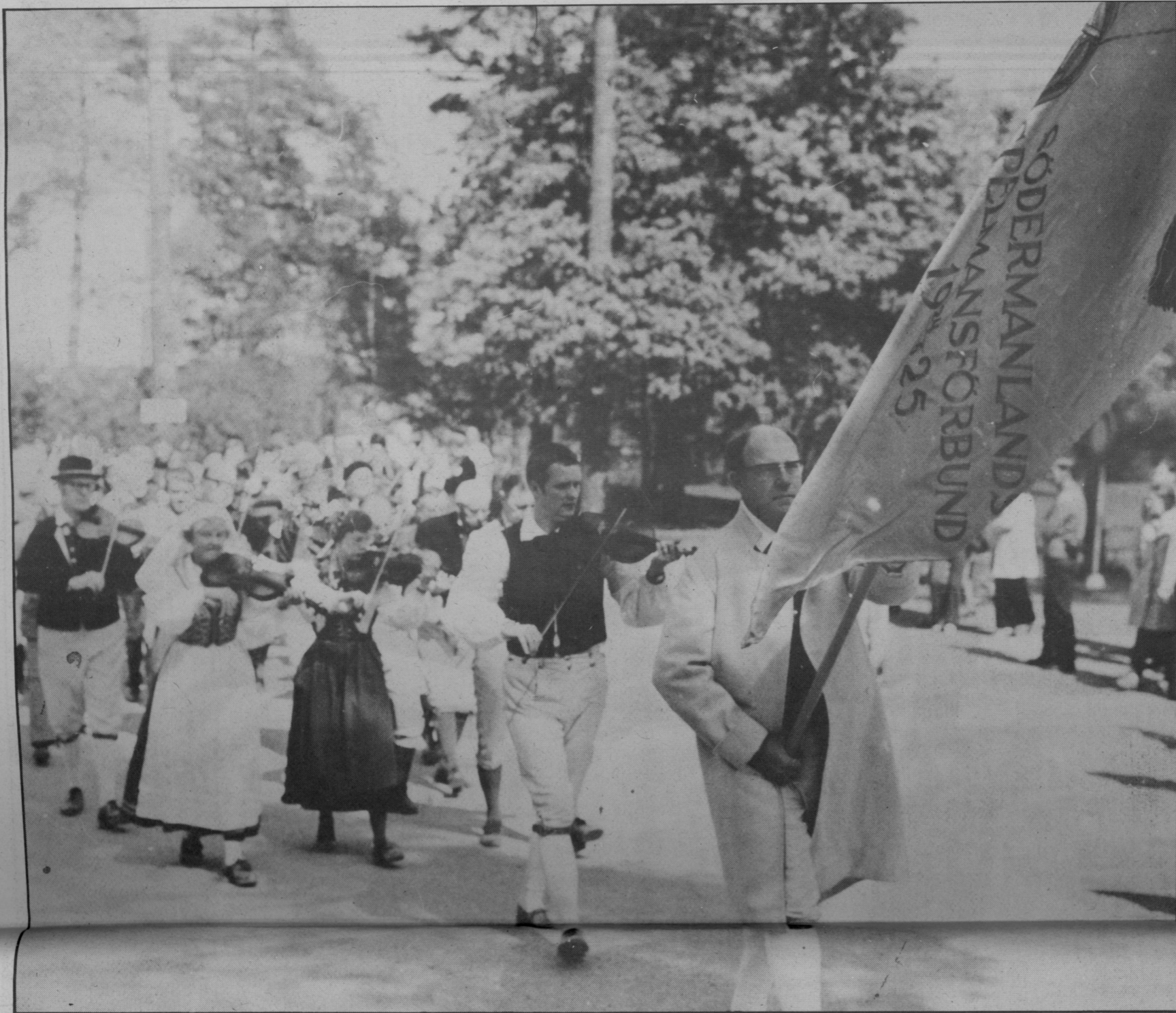
Spelmän på frammarsch. År 1925, för 60 år sedan, bildades Södermanlands spelmansförbund av ett 30-tal spelmän. I dag har förbundet 700 medlemmar.