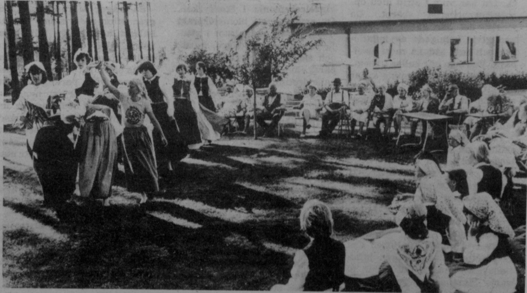
Rekarne folkdanslag stod för underhållningen i Hemlaås, Hällby.