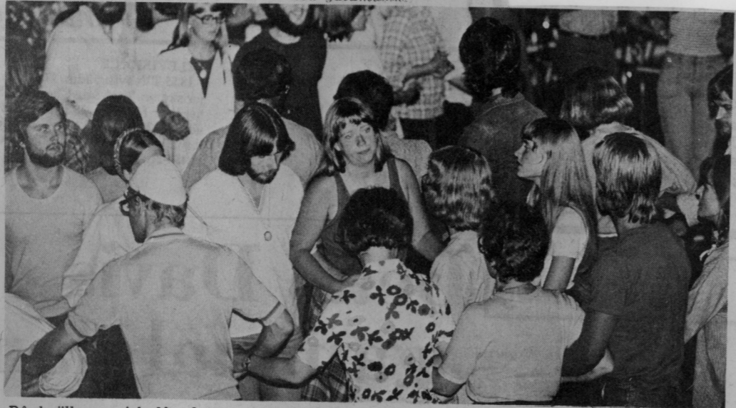
På kvällarna gick långdansen i stora bukter till levande musik i Ingesundsskolans aula.