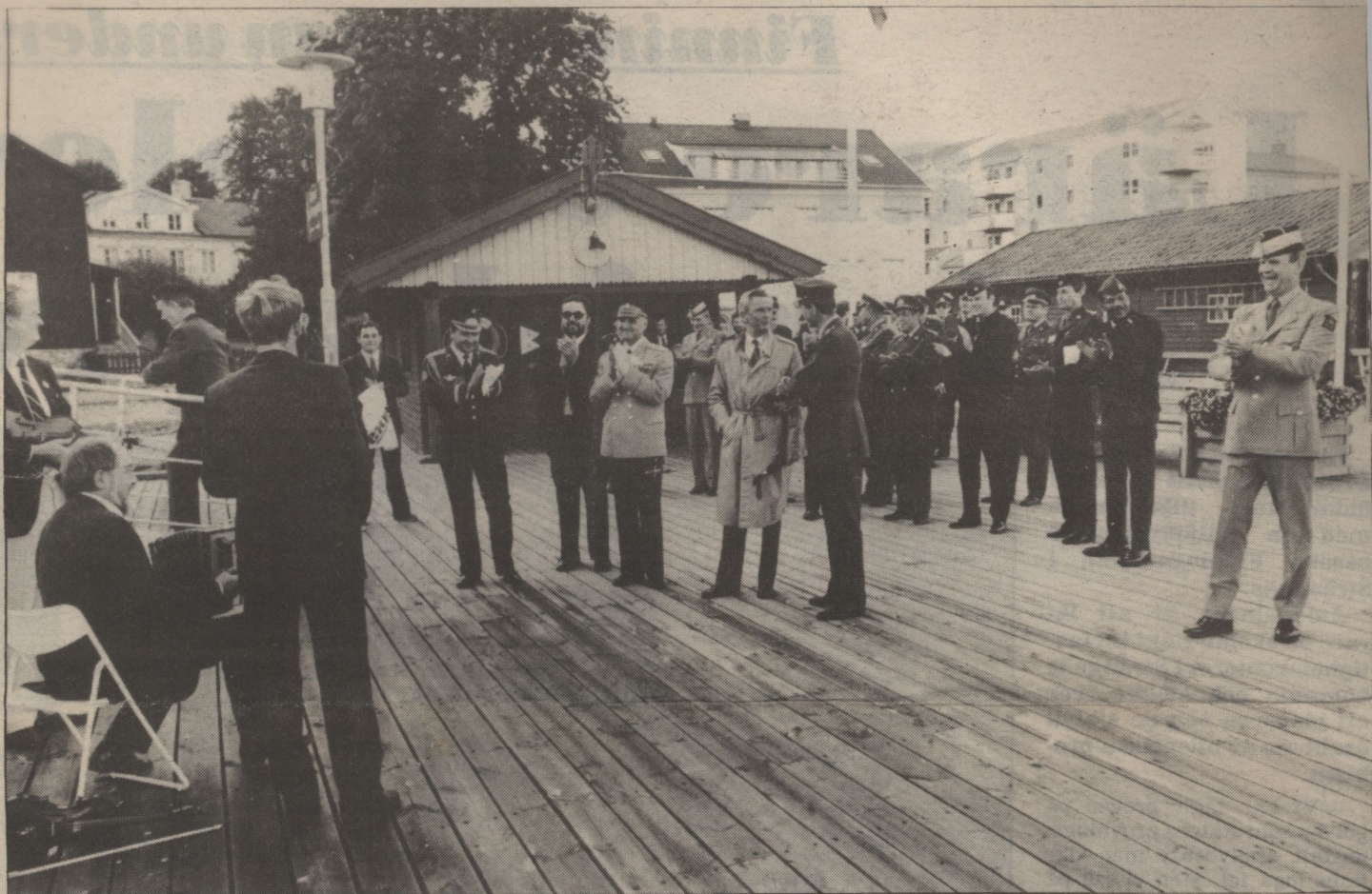
Strängnäs kommun bjöd 50 representanter på middag och båttur på Mälaren. Spelmän svarade för underhållningen.