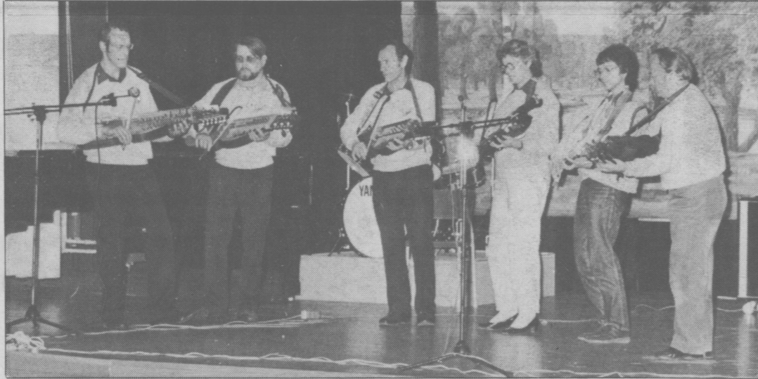
En av grupperna som underhöll på nyckelharpa var Bygdens blandning, som här ses i aktion.