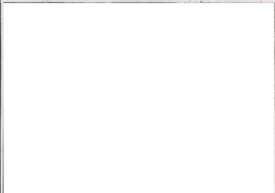
Somliga tycker det är tröttsamt när vuxna pratar för mycket. En liten krabat har somnat tryggt.