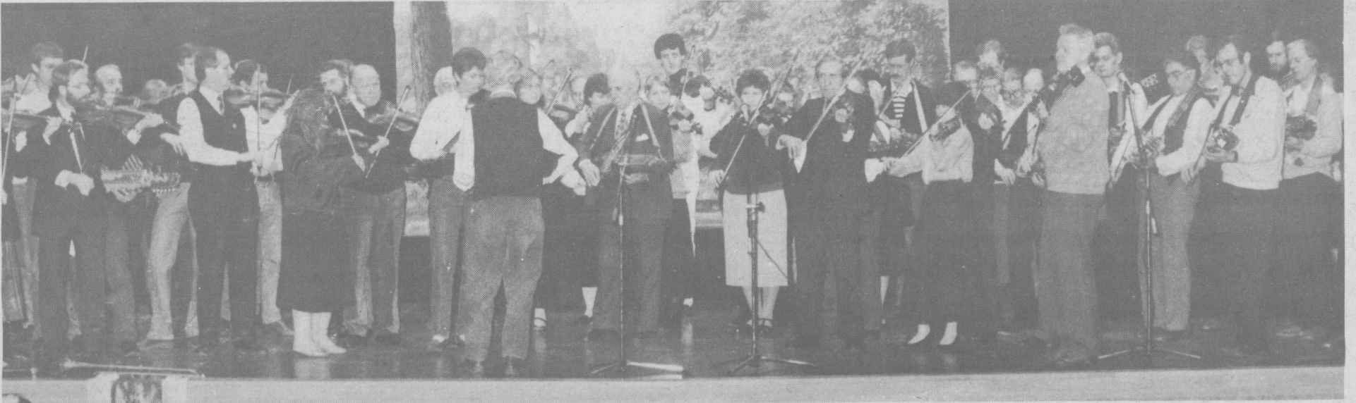
Både äldre och senare folkmusik spelades på stämman i Gnesta på lördagen. Här är det inledningen med allspel med spelmän från hela Sörmland.