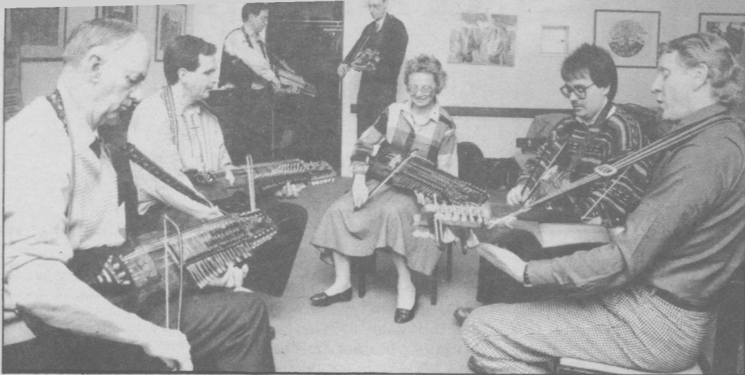
Sju glada spelmän med nyckelharporna i högsta hugg ägnade sig åt "buskspel" i ett av de övre rummen i Folkets hus. Inte är det väl lika mysigt som en riktig spelmansbuske, men de ser ju ut att ha det trevligt ändå.