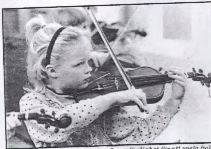
Det krävs fingerfärdighet för att spela fiol.