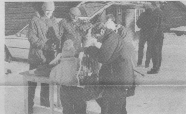
Här gäller det att lista ut vad årets kalkon heter. Kalkonen själv utgör förstapris i tävlingen.