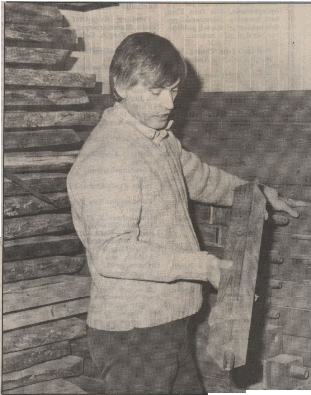
Kålmån har många träpipor i lager i sin verkstad. Ofta bygger han om en gammal orgel till mindre. Ett parti bra ekplank ligger på tork i väntan på att så småningom bli en del av en ny orgel.