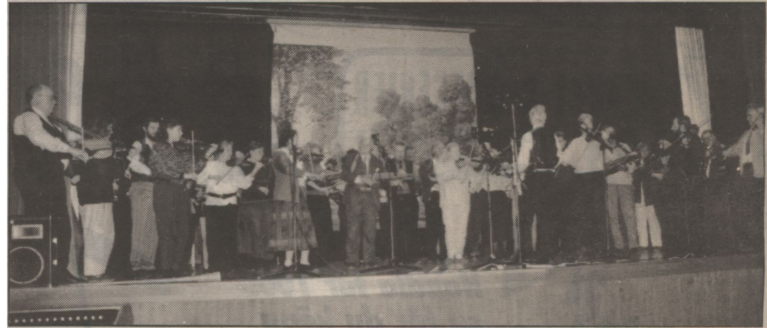
Scenen fylldes med nära 90 spelmän när det vardags för allspel.

Uppskattningsvis var det omkring 400 personer som besökte Elektron på lördagen.