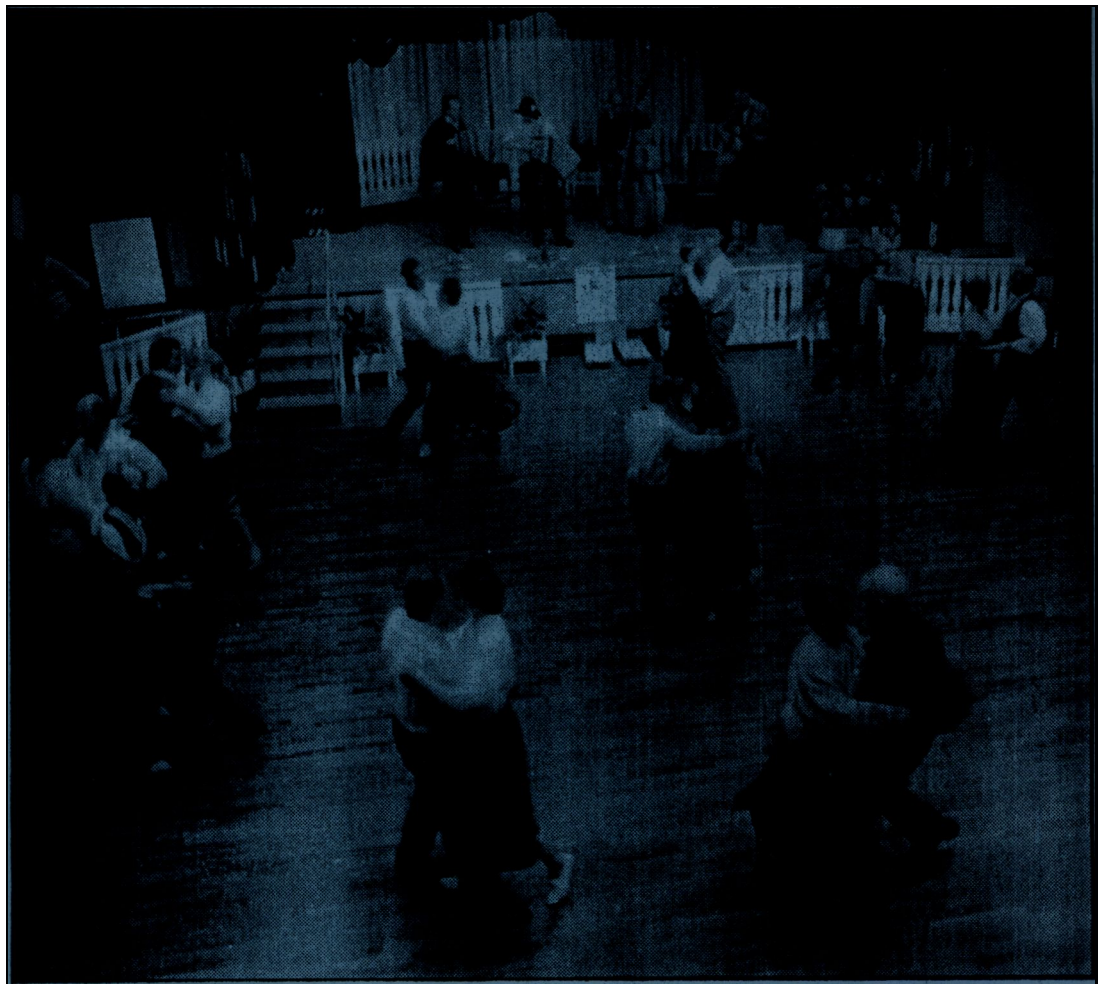
På kvällen röjdes stolar undan och det bjöds upp till dans på spelmansstämman.