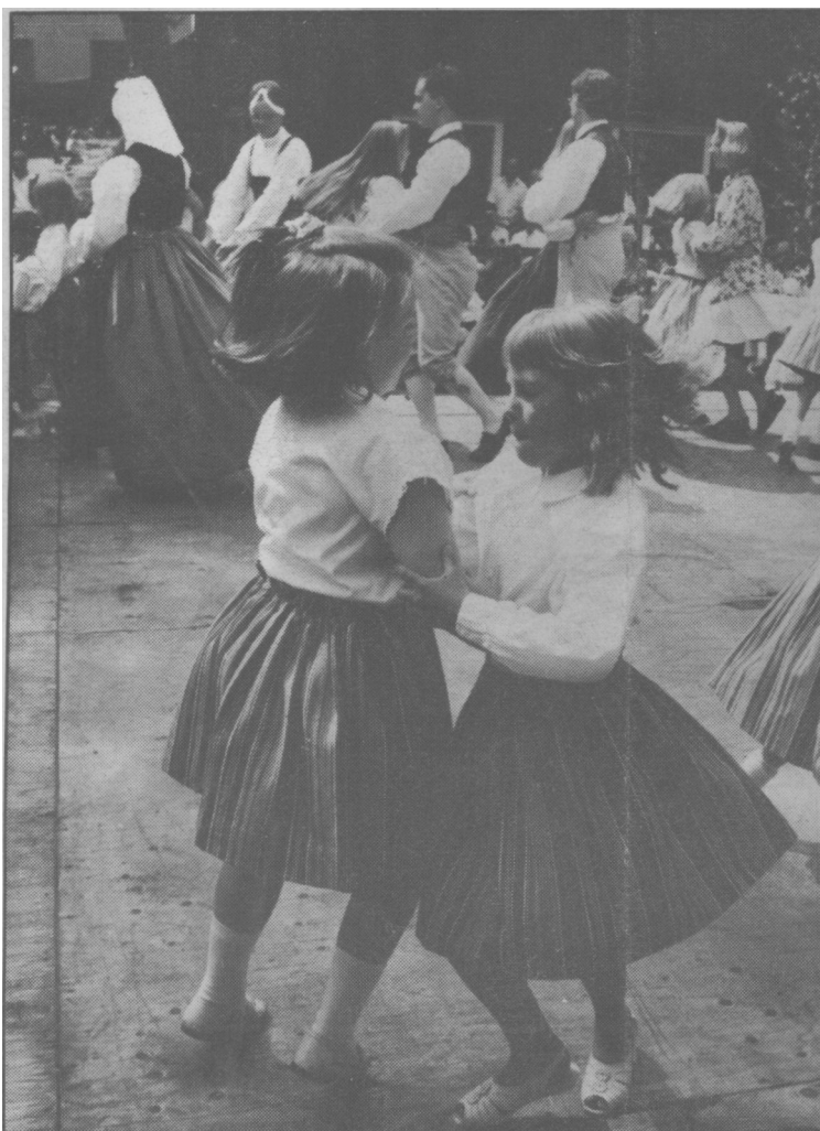
ungdomsgrupp visade vadden kan på Spelmansstämman so i hölls i Rademachersmedjorna i lördags.

Det ser ut som om spelmännen knäpper på strängarna när de spelar. Av någon anledning lade allihopa huvudet på sned