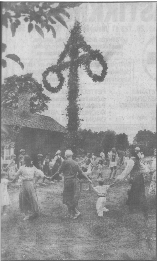
En majstång kan se ut på många olika sätt. Majstången vid Stenkvista, Eskilstuna, är av den vanligaste typen, en sk korsstång med kranor längst ut på tvärstången.