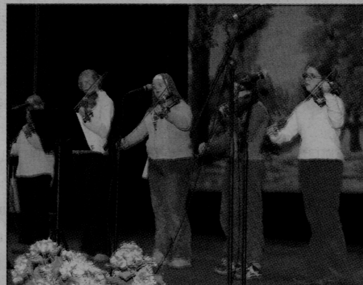
Orkestern: Liten fiol, från Gnesta musikskola framförde bland annat Äppelbo gånglåt.