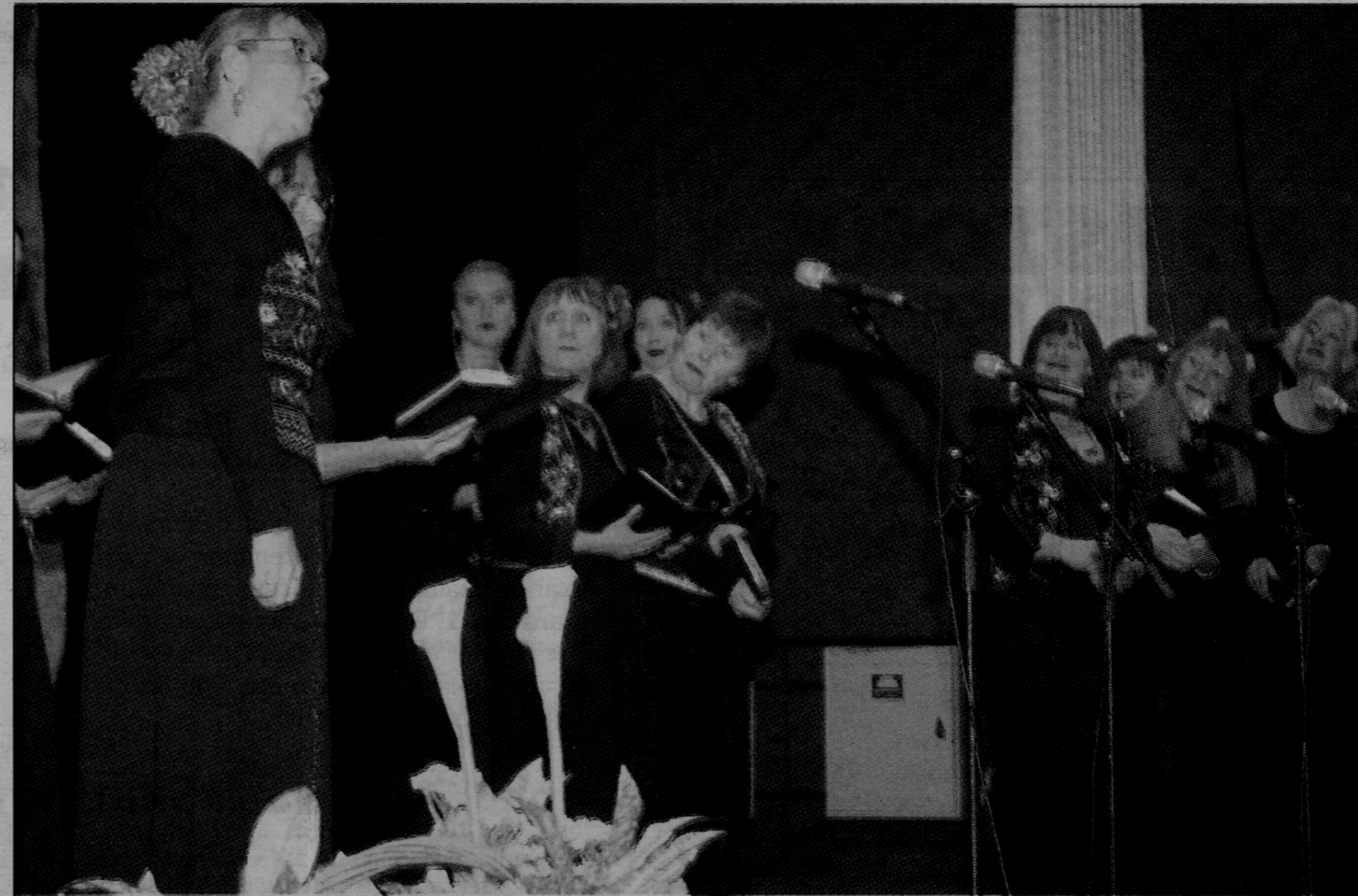
Stockholms bulgariska damkör är trots namnet helt nordisk. Sången är på bulgariska.