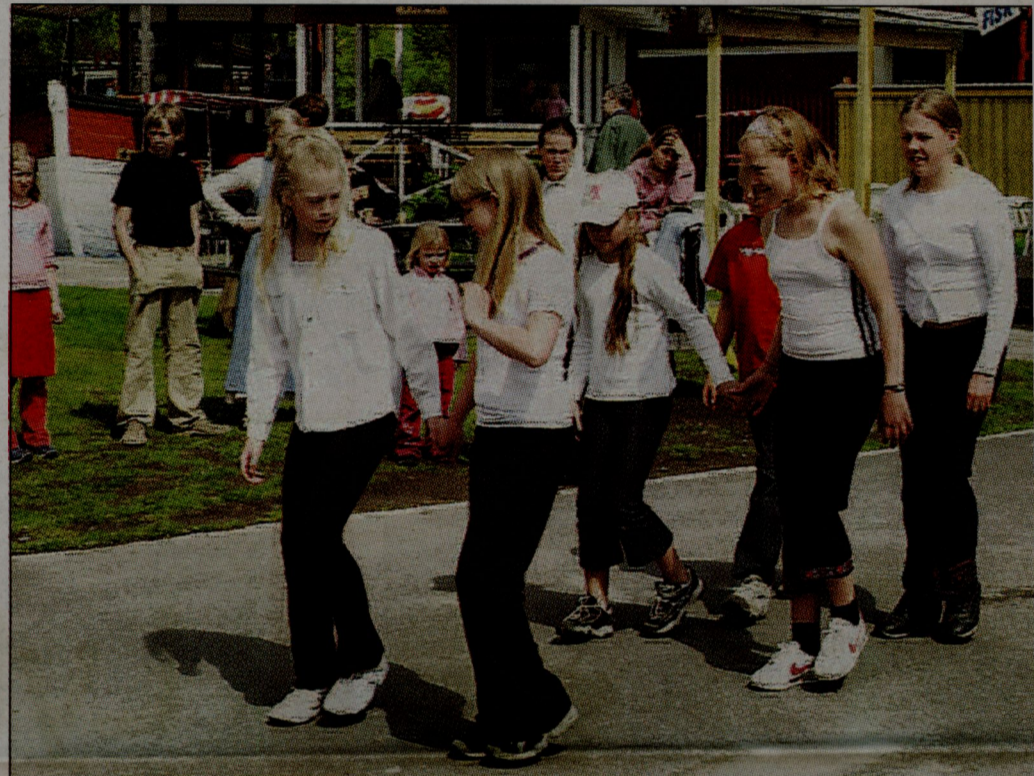
Musikskolans nybörjargrupp dansar för Trosa.

I den äldre nybörjargruppen är eleverna cirka tio år och uppåt. Till tonerna av Jill Jonssons melodifestivalbidrag Cra-