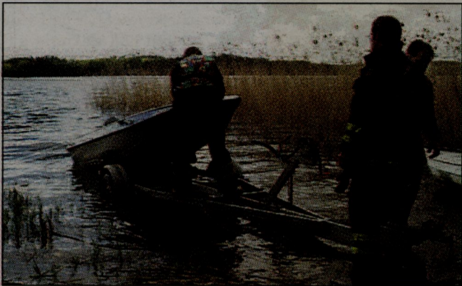
Järna räddningstjänst letade i helgen efter olja i sjön Sillen.