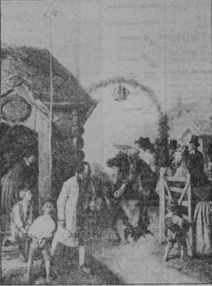
Bröllopsföljet anländer till jäsörsgård med spelmän och präst. Målning av J W Wallander från 1800-talets senare hälft. På gården står välkomstsuparna redo: se om klabblåten i texten.

Från Gotland omtalas att runddål (rundarium) spelades när skålen druckits, bruden fått sin skänk och givaren en sup som kvitto.