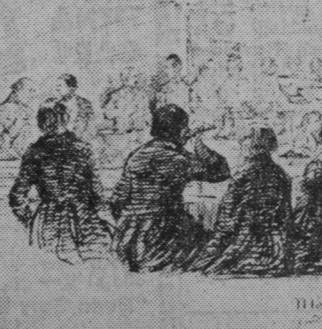
Måltiden, teckning av J W Wallander med underrubriken Grötrim. Spelmännen var som synes i full aktion medan gästerna slevade i sig.

Brudskålmusiken spelades en gång igenom för varje person bruden skålade med. När hon föreslog ny skål tytnade musiken och namnet på den hedrade ropades upp, varpå han överlämnade sin gåva.