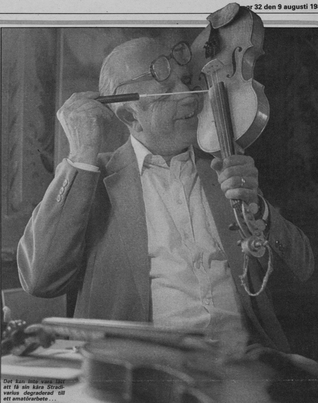
Det kan inte vara lätt att få sin kära Stradivarius degraderad till ett amatörarbete...