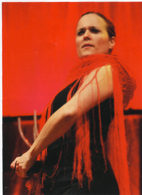
Många kulturer visades upp, här flamenco.