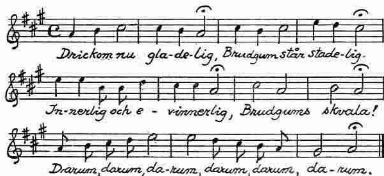
Fig. 6. Skålsång från Runö. Idun 1907, sid. 536.

Även andra skålstycken än de förut nämnda kunna sättas i