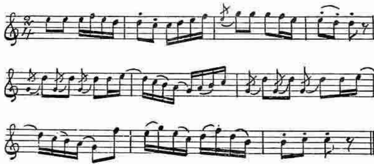
Fig. 3. Brudens och brudgummens skål etc. Klintberg, Polskor och högtidsstycken från Gotland, n:r 43 »rundarium».

I Skåne förekom samma sed på bondbröllopen. Sedan alla hedersskålar på en gång druckits, berättar Nicolovius, vände sig värden, om han var vid skämtsamt lynne, till spelmännen och sade »skål spelemän». Dessa besvarade artigheten med att härma fanfarer på sina fioler. Detta kallade de rundarer.