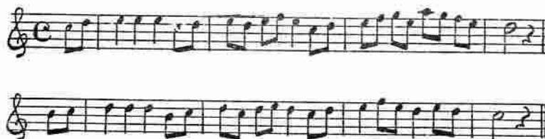
Fig. 5. Runda. Efter original i Finspångsarkivet 9,098, sid. 63.

Dansa är inte färligt, men akta er för pojkarne. (Bohuslän).