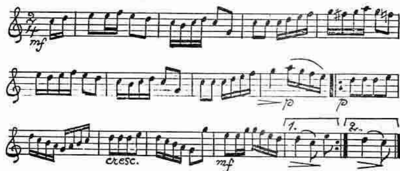
Fig. 2. Brudskålsmusik från Floda socken, Södermanland. A. G. Rosenberg, 160 polskor, visor och danslekar etc., nr 140.

I sin första folkmusiksamling med huvudsakligen sörmländska