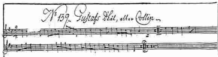
Fig. 7. Gustafs skål. Åkerhielmiska notboken, Kungliga biblioteket, Stockholm.

Kungen lyssnade till första versen och ropade högt: »Tack