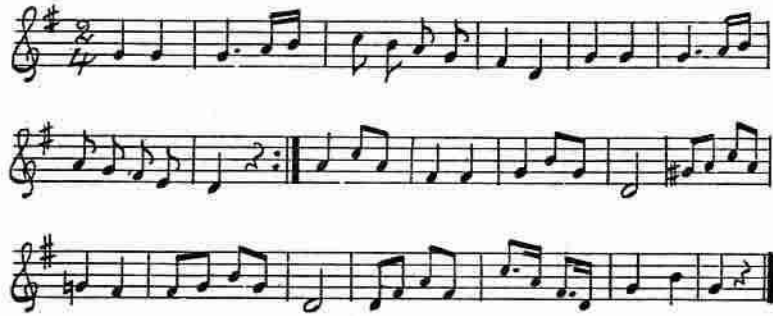
Fig. 9. Vestris dans till Fredmans testamente 136. Par Bricoles handskrift 137. (Se E. Sundström, Ny' Bellmansmusik, Svensk tidskrift för musikforskning 1927).

talet och man vill gärna fråga sig, om inte den överväldigande popularitet, som melodien till Gustavs skål ägt hos allmogen (Carlén kallar den för bondbröllopsmarsch) kan lättast förklaras därigenom, att den redan före 1772 varit känd av allmogen som