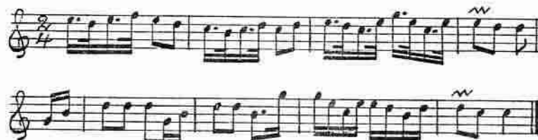
Fig. 4. »Steklåt». R. Liljefors, Upländsk folkmusik, steklåt n:r 2, sid. 86.

Melodiernas gemensamma drag äro tillräckligt tydliga för att utpeka släktskapen dem emellan, och för övrigt ha rundarium- och rundamelodierna använts vid samma tillfällen, nämligen när skålar druckos. Bakom rundamelodien, vars andra repris egentligen är en upprepning av den första fast ett tonsteg lägre, ligger säkerligen en vokal melodi. Båda repriser- nas första tvåtaktsfras har från början varit en dubbeltakt, vari de tre markerade fjärdedelarna på samma ton föra tanken på