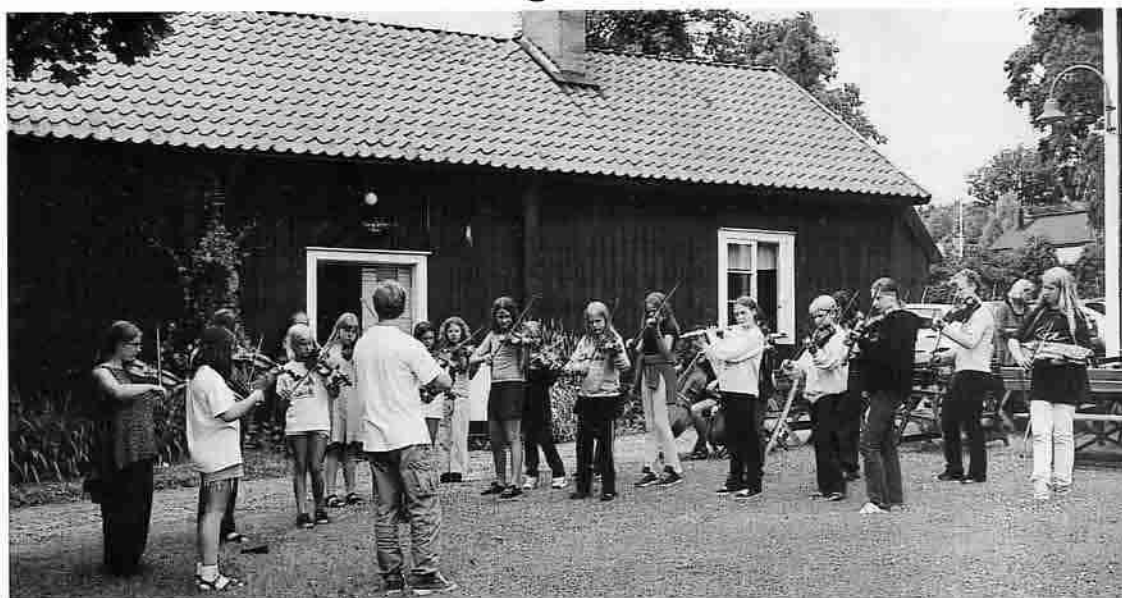
Låtläget -99 samlat utanför GW-stugan

För andra året i rad har det traditionella Låtläget i Sörmland ägt rum. Det ligger alltid i veckan efter midsommar och har hittills varje gång avhållits i Anskarsgården utanför Flen.