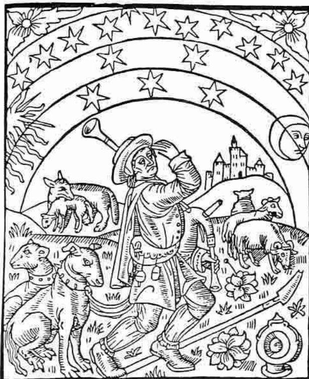
Holzschnitt um 1480. Auch in H. Grosse-Jäger, K. Egger: Weihnachten im Lied (Tyrolia) siehe S. 413