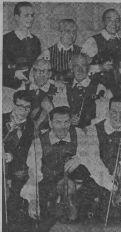
Här är hela Södertälje spelmannslag sa bygdedräkt. Med finns dräkter från bå