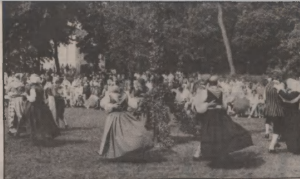
Det danska folkdanslaget från Colding var värt att se, inte minst för de många vackra dräkternas skull.

Det var också folkdansuppvisning av ett folkdanslag från Colding i Danmark. De var mycket