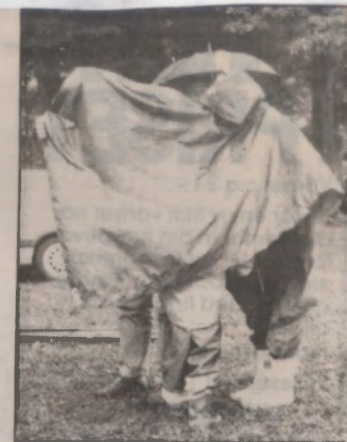
Det gäller att skydda sig mot regnet. Under det här regnstället fick det rum minst tre personer och en fiol.